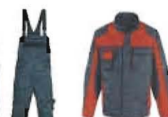
Farbcodierung 9755 anthrazit / mittelrot