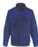
Farbcodierung 4946 marine / Kbl.blau

In weiteren Farbkombinationen lieferbar: