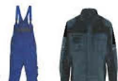
Farbcodierung 9799 anthrazit / schwarz