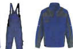
Farbcodierung 4697 Kbl.blau / anthrazit