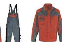
Farbcodierung 5597 mittelrot / anthrazit